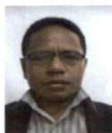
Presidente do Júri