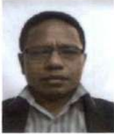
Presidente do Júri