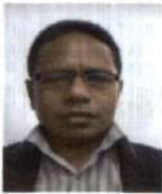
Presidente do Júri