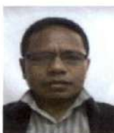
Presidente do Júri