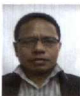
Presidente do Júri