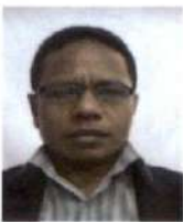
Preisdente do Júri